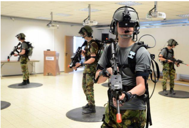
Gambar 5. Virtual Reality dalam Simulasi Militer.

Teknologi Virtual Reality sudah banyak digunakan dalam berbagai bidang. Seperti bidang kedokteran, penerbangan, militer, bahkan juga digunakan sebagai perangkat pendukung untuk bermain game (Gambar 5).