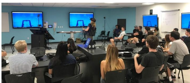
Gambar 7. Penerapan teknologi paa proses pembelajaran

sangat memiliki peran penting atas kehidupan manusia sebagai makhluk sosial yang selalu berinteraksi. Begitupun halnya dengan kebutuhan didalam pendidikan, pembelajaran menjadi sangat menyenangkan, memberikan keleluasaan didalam menciptakan nilai-nilai kreatifitas, melakukan pengembangan menjadi sebuah inovasi baru berupa konsep perancangan sebuah produk yang dihasilkan. Kemudahan dan presisi yang diberikan oleh teknologi sangat baik, seperti dalam kegiatan sebuah pendidikan desain dalam merancang sebuah produk misalnya, pembuatan model sebuah transportasi berkonsep electric car. Dengan menggunakan 3D printing menjadi sangat mudah dan presisi, melakukan tugasnya dengan cepat dan tepat, serta didukung oleh berbagai macam material yang disesuaikan oleh kebutuhan siswa dalam merancang sebuah visual 3d model konsep desain berupa contoh model.