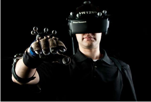
Gambar 4. Virtual Reality .

sebenarnya mereka hanya berada di dunia virtual atau dunia maya. Untuk mendukung jalannya teknologi Virtual Reality ini, biasanya pengguna juga bisa menggunakan beberapa perangkat yang canggih berupa helm atau kacamata, headset , sarung tangan dan walker (Gambar 4).