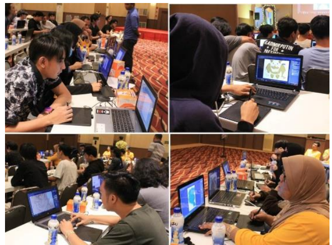
Gambar 6. Kelas workshop Digital Imaging

Revolusi Industri 4.0 mendorong kurikulum pendidikan tinggi agar sesuai dengan dinamika digital, internet of thing , Artificial Intelligence , bioteknologi, serta perkembangan pesat lainnya. Jika tidak disesuaikan, lulusan perguruan tinggi tidak akan sesuai untuk menjadi pemikir dan pekerja di era ini. Revolusi Industri 4.0 mendorong kurikulum pendidikan tinggi agar sesuai dengan dinamika digital, internet of thing , Artificial Intelligence , bioteknologi, serta perkembangan pesat lainnya. Jika tidak disesuaikan, lulusan perguruan tinggi tidak akan sesuai untuk menjadi pemikir dan pekerja di era ini. Perkembangan pendidikan di dunia tidak lepas dari adanya perkembangan dari revolusi industri yang terjadi di dunia, karena secara tidak langsung perubahan tatanan ekonomi turut merubah tatanan pendidikan di suatu negara (Gambar 6).