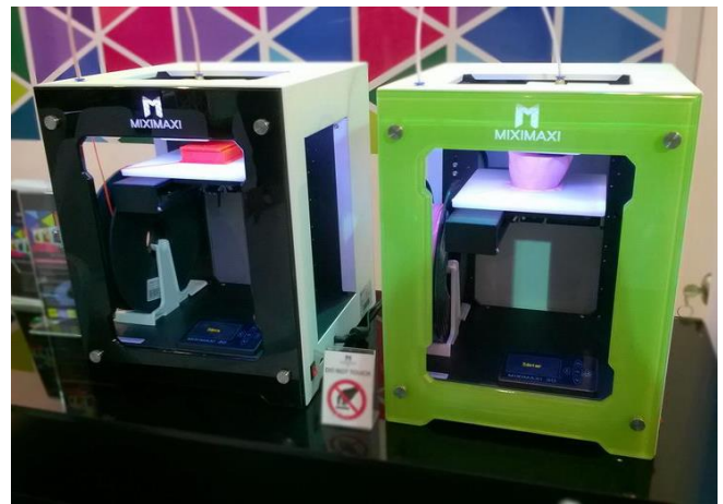
Gambar 3. 3D Printer dari Miximaxi

Revolusi Industri 4.0 adalah sebuah revolusi fundamental yang perlu dihadapi dengan persiapan yang matang, karena menuntut berbagai kemampuan dasar yang belum dituntut oleh pasar tenaga kerja saat ini.