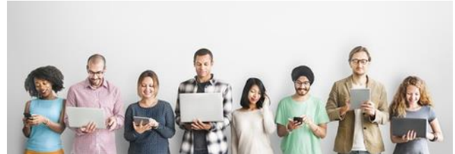
Gambar 1. Masyarakat Digital

dengan menekan beberapa digit (angka) yang di susun dengan berbagai urutan. Relasi yang terbangun di antara individu adalah relasi pertukaran digital, setiap manusia hanya melakukan serangkaian transaksi atau interaksi melalui simbol-simbol digital. Transaksi perdagangan, komunikasi, semuanya digerakkan Kemajuan Teknologi dan Pola Hidup Manusia (Gambar 1) .