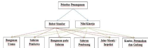
Gambar 4. Struktur Hierarki Prioritas Perbaikan Berat Aspek Prasarana Fisik

Prioritas penanganan Prasarana Fisik dinilai berdasarkan enam parameter yaitu bangunan utama, saluran pembawa, Bangunan pada saluran pembawa, Saluran Pembuang dan Bangunannya, Jalan masuk / Inspeksi, dan Kantor, Perumahan dan Gudang.