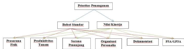
Gambar 3. Struktur Hierarki Prioritas Penanganan Sistem Irigasi D.I Wonosari

Hasil analisis kinerja sistem irigasi digunakan untuk menentukan prioritas penanganan dengan metode Analytical Hierarchy Process (AHP).