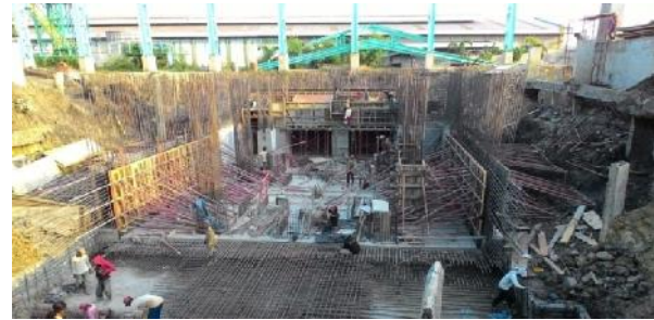
Gambar 1. Galian untuk Pondasi Mesin dan Kolom Terlalu Dekat

Tanah Longsor menempati peringkat ketiga dari 3 besar penyebab proyek PT. Jatim Taman Steel mengalami keterlambatan dengan tingkat signifikansi sebesar 80 %, tanah longsor menyebabkan 2 set kolom pedestal roboh serta 6 tiang pancang yang telah tertanam patah (gambar 4).