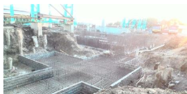
Gambar 2. Pembesian Mesin yang Telah Mengalami Perubahan Desain