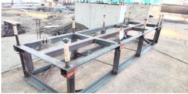
Gambar 3. Pembuatan Anchor yang Telah Mengalami Perubahan Desain