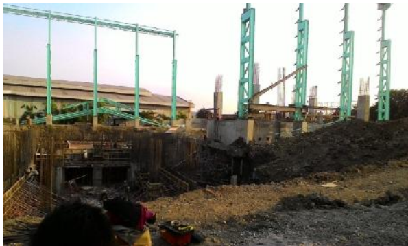
Gambar 4. Lokasi Longsor di PT Jatim Taman Steel

Hal ini disebabkan oleh durasi turunnya hujan yang lama dengan kriteria hujan lebat ditambah dengan lokasi kolom pedestal terletak dekat dengan galian pondasi mesin tanpa diberikan penahan.