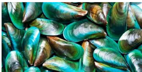
Gambar 1: Kerang hijau.

yang memiliki kemampuan paling besar dalam mengabsorpsi bunyi.