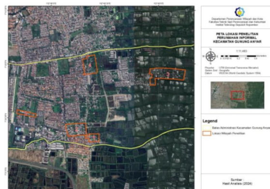
Gambar 1. Lokasi Perumahan Informal di Kecamatan Gunung Anyar

Lokasi perumahan informal yang diidentifikasi berlokasi di Kecamatan Gunung Anyar, Kota Surabaya. Terdapat lima