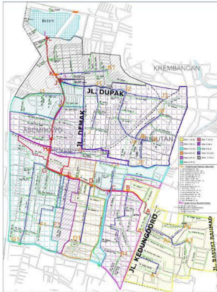
Gambar 1. Peta Sistem Pematasan Greges