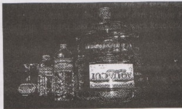
Gambar 1. Produk Aquacui

PT Aneka Tirta Sukoindo adalah perusahaan air minum yang didirikan oleh Bapak Otje Suwandito pada tanggal 1 Januari 2003, perusahaan tersebut memproduksi air minum dalam kemasan (AMDK) dengan merek dagang "Aquacui". Pabrik air minum dalam kemasan PT Aneka Tirta Sukoindo berlokasi di Desa Lemahbang Km 53, Sukorejo-Pandaan. PT Aneka Tirta Sukoindo memproduksi AMDK dalam berbagai bentuk dan kemasan, antara lain: kemasan cup (240 ml), kemasan botol (600 ml dan 1500 ml), dan kemasan galon (19 liter).